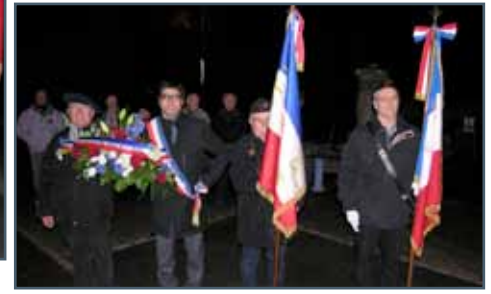
CÉRÉMONIE DU 5 DÉCEMBRE EN L'HONNEUR DES SOLDATS MORTS POUR LA FRANCE EN ALGÉRIE, TUNISIE ET MAROC