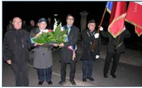
CÉRÉMONIE DU 17 NOVEMBRE : LIBÉRATION DE SAINTE-SUZANNE