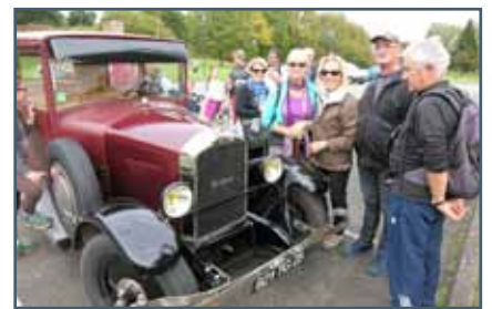
Quelques balades de la SOSS